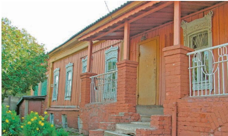
Здание бывшей фабрики фруктовой пастилы с 1925 по 1977 годы служило санитарно-бактериологической лабораторией.

После 1917 года в уезде сформировали отдел здравоохранения, в состав которого вошёл и санитарно-эпидемиологический отдел. До того как служба получит гораздо больше полномочий, а, соответственно, и возможностей для улучшения качества жизни людей, оставалось пять лет. По статистике, с 1917 по 1922 годы в Коломенском уезде насчитывалось порядка 140 тысяч жителей. Санитарные врачи в этот период фиксируют 1174 случая заболеваний натуральной оспой, 334 случая холеры, 2513 случаев брюшного тифа, 19819 случаев сыпного тифа, 5372 случая возвратного тифа, 2199 случаев тифа «неопределённого», 1683 случая малярии, 632 случая туберкулёза, 697 случаев дифтерии, 3948 случаев дизентерии. И это только приблизительные цифры. С 1921 по 1923 годы 29% населения Коломенского уезда умирали от